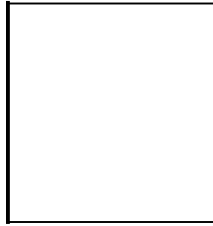
Photograph of alien removed

Person, date, and manner of removal: _____